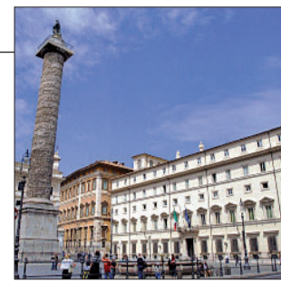
L'ITALIA RICORRE Il governo: nessuna libertà violata

In prima istanza, il 3 novembre 2009 una camera (sette giudici) della seconda sezione della Corte di Strasburgo, all'unanimità, dà ragione alla Lautsi. Del collegio fa parte per l'Italia Vladimiro Zagrebelsky, (poi sostituito da Guido Raimondi). L'Italia è condannata a risarcire 5mila euro per danni morali. L'esposizione del crocifisso – dice la sentenza – sarebbe stata «emotivamente conturbante» per gli studenti che non professano alcuna religione o ne professano una diversa dalla cattolica, violando la libertà di educazione.