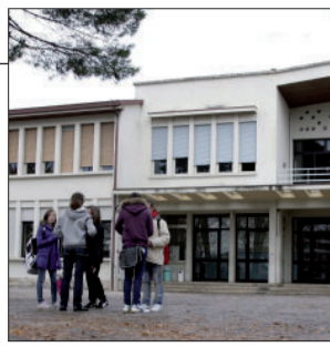
IL CASO DI ABANO TERME La madre finlandese contro la scuola

Per il direttore della Sala Stampa vaticana i giudici hanno riconosciuto «che la cultura dei diritti dell'uomo non va contrapposta ai fondamenti religiosi della civiltà europea» Il presidente della Cei sottolinea il «buon senso» di un verdetto che «esprime valori ampiamente condivisi dalla cultura occidentale»