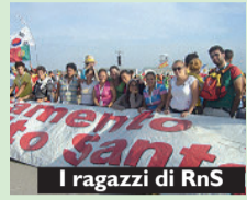
I ragazzi di RnS