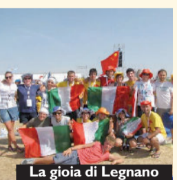
La gioia di Legnano