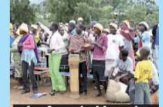
La festa in Uganda