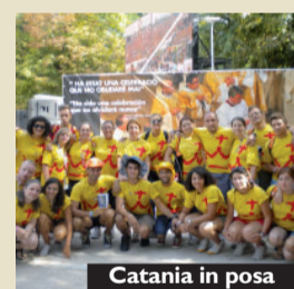
Catania in posa