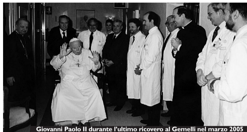
Giovanni Paolo II durante l'ultimo ricovero al Gemelli nel marzo 2005

In centinaia di migliaia hanno affollato le cattedrali e le piazze delle grandi città così come i piccoli centri per manifestare la propria gratitudine