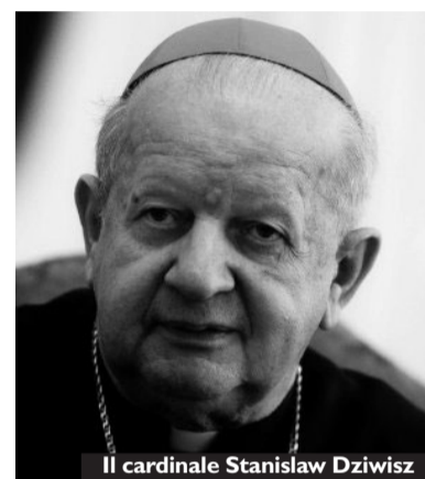
Il cardinale Stanisław Dziwisz

Parla il cardinale, segretario di Wojtyła per 40 anni