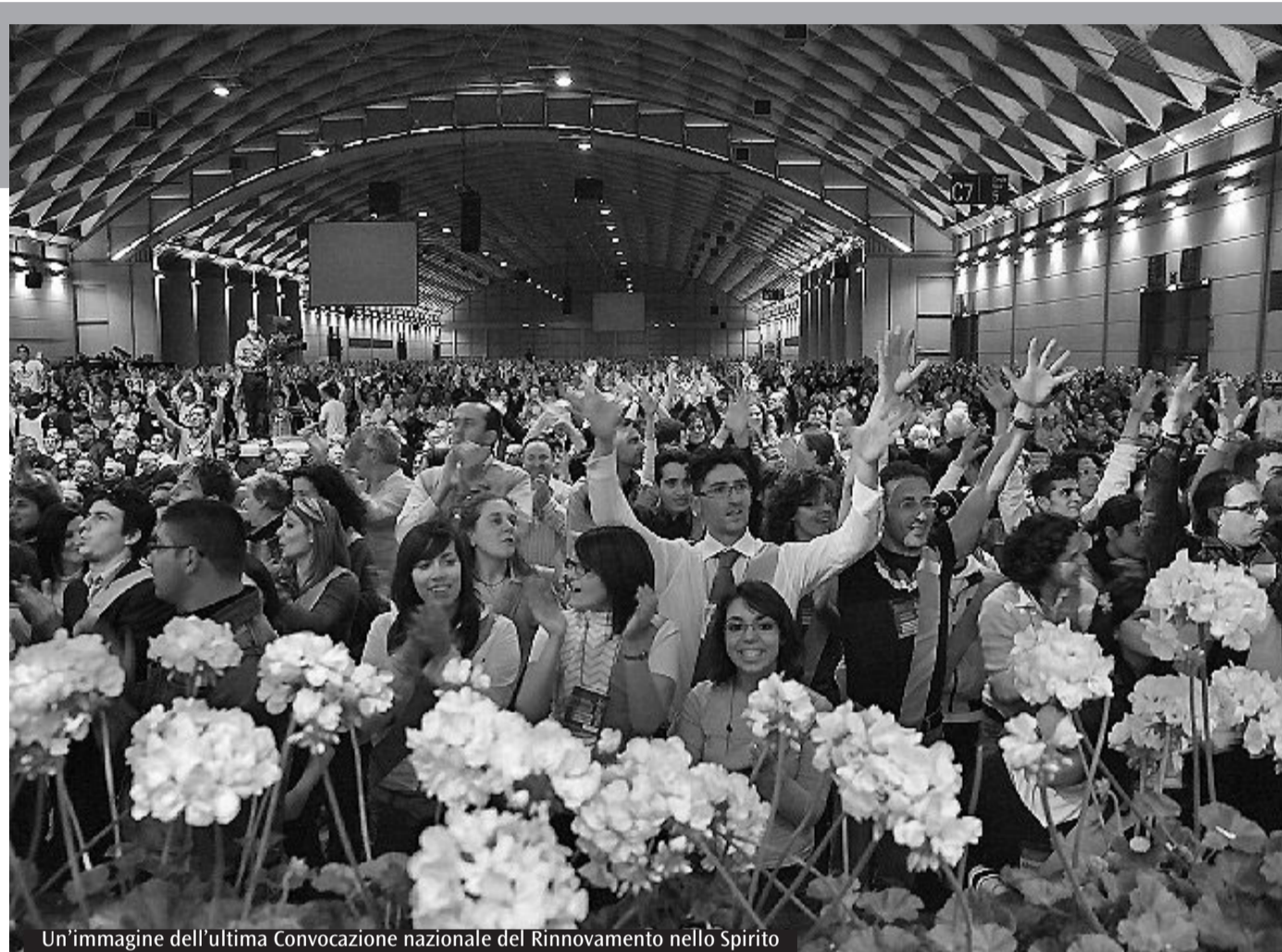
Un'immagine dell'ultima Convocazione nazionale del Rinnovo nello Spirito

Per la 32 a Convocazione nazionale Rinnovo nello Spirito Santo mette al centro il dovere dell'annuncio