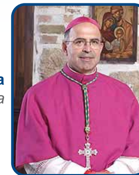
S.E.R. Mons. Angelo Spina Vescovo di Sulmona-Valva